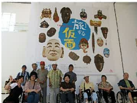
デイサービス・ミニドライブは県立博物館企画展『旅する仮面』観賞に出かけました♪