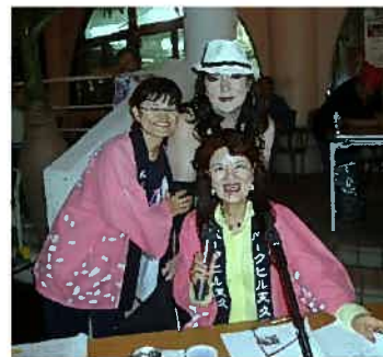
総合司会は いぢみなせんごさん 盛り上げてくれました♪