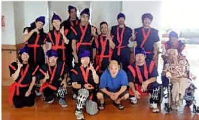
ご入居者と一緒に記念撮影