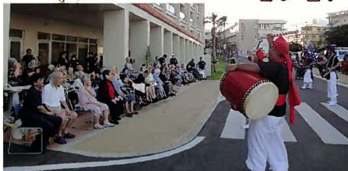
『介護付き有料老人ホーム天久ヒルトップ』で勇壮に演舞された『道ジュネーエイサー』★ご入居の皆さまも笑顔いっぱいです♪ 沖縄大学エイサーサークル『新風』の皆さんの素晴らしいエイサーに感謝です。ありがとうございました♪