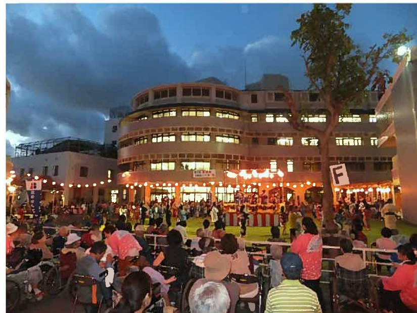
『介護老人保健施設パークヒル天久』ご利用や入所の皆さまの参加風景です