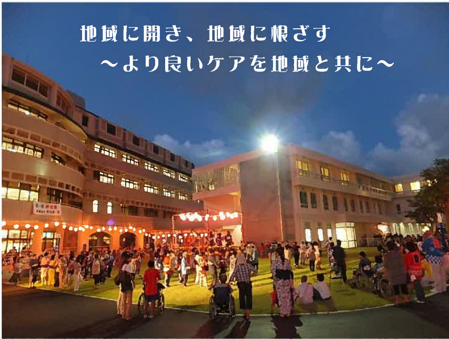
フォト(パークヒル天久・理学療法士:内閣尚)