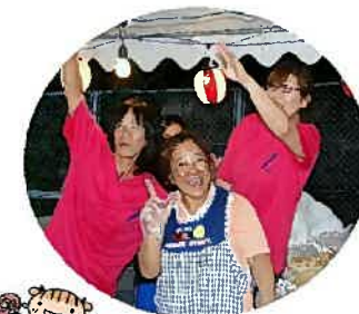
デイケア×デイサービスは 屋台を出店しました♪