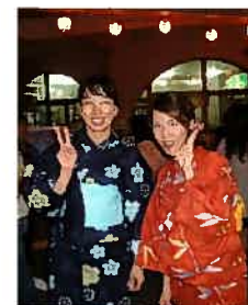
盆踊りを担当した 天久ヒルトップ 理学療法士のふたり