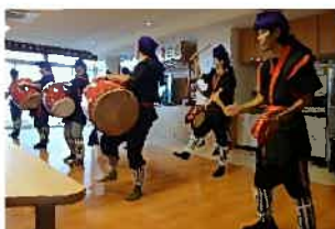
職員のエイサーチームが8月の誕生会を華やかに盛り上げてくれました♪