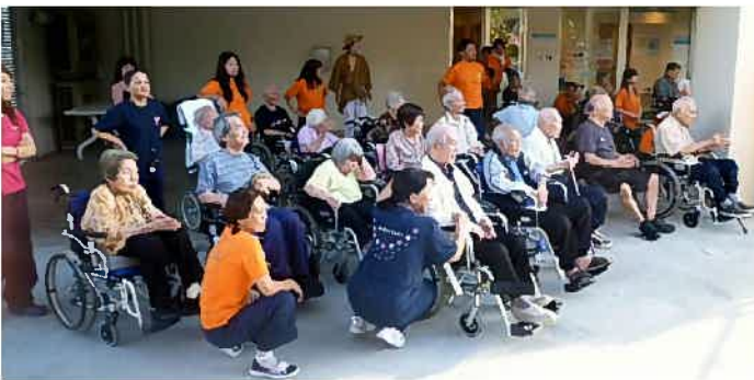
楽しんでエイサーを観賞される『うえの家』ご利用の皆さま